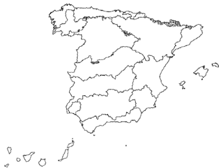
Tipo 27. Ríos de alta montaña