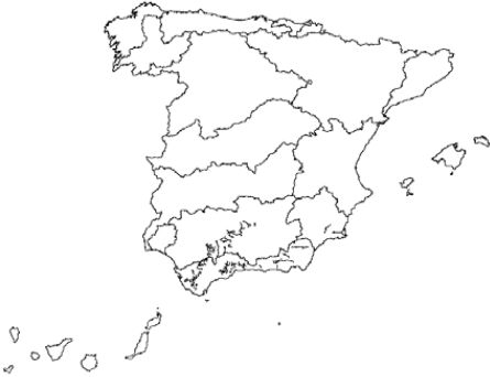
Tipo 7. Ríos mineralizados mediterráneos de baja altitud