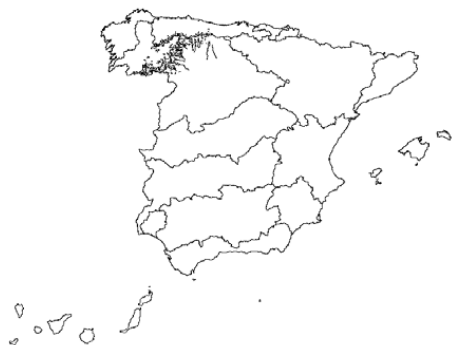
Tipo 25. Ríos de montaña húmeda silíceo