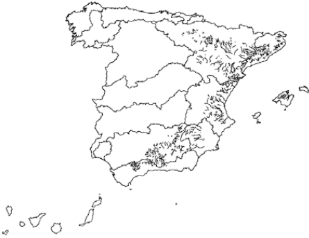
Tipo 9. Ríos mineralizados de la baja montaña mediterránea