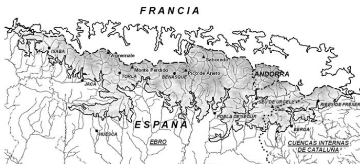
Figura 2. Detalle de la parte española de la región ecológica Pirineos

La región de los Pirineos queda delimitada por la zona pirenaica situada por encima de 1.000 m de altitud y comprende parte de la cuenca del Ebro y de las Cuencas Internas de Cataluña, según se detalla en la figura 2.