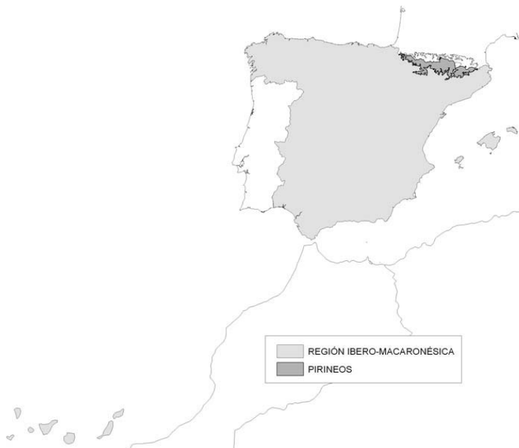
Figura 1. Regiones ecológicas de ríos y lagos

La región de los Pirineos queda delimitada por la zona pirenaica situada por encima de 1.000 m de altitud y comprende parte de la cuenca del Ebro y de las Cuencas Internas de Cataluña, según se detalla en la figura 2.