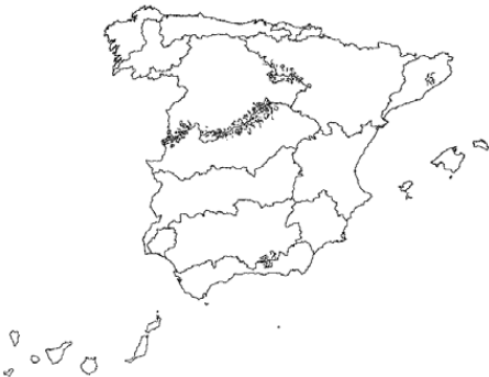
Tipo 11. Ríos de montaña mediterránea silícea