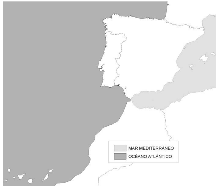
Figura 3. Regiones ecológicas de aguas de transición y costeras

Las regiones ecológicas de las aguas de transición y costeras serán el Océano Atlántico y el Mar Mediterráneo, como se muestra en la figura 3.