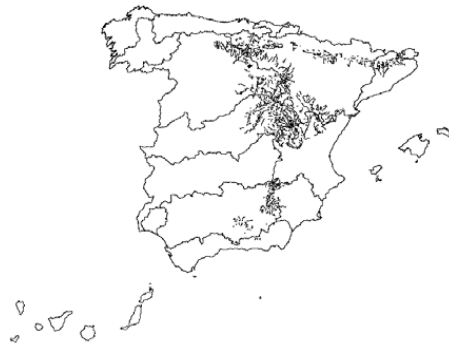
Tipo 12. Ríos de montaña mediterránea calcárea