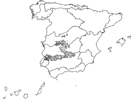
Tipo 8. Ríos de la baja montaña mediterránea silícea